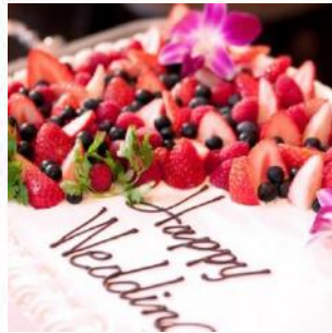
オリジナルウエディングケーキ