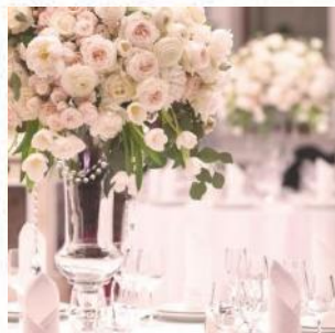
装花 (メインテーブル装花)