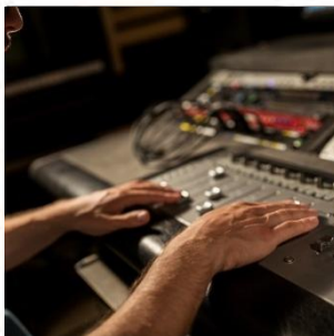
音響オペレーター