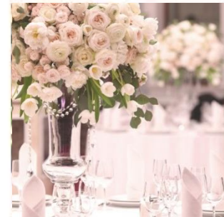
装花 (メインテーブル装花・ブーケブートニア)