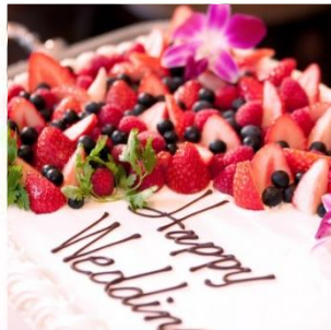
オリジナルウェディングケーキ