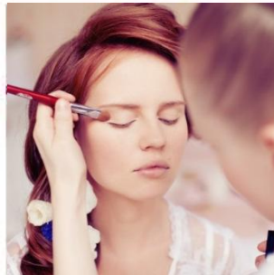
ご新婦メイク・お着付け